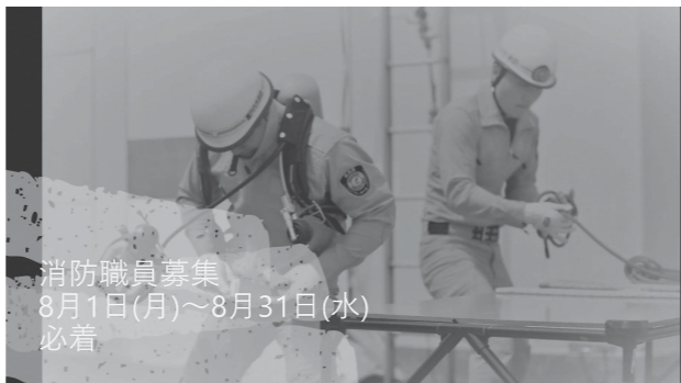
消防職員募集 8月1日(月)~8月31日(水) 必着

市では、次のとおり消防職員を募集します。詳細は受験案内をご確認ください。なお、新型コロナウイルス感染症の影響により、日程や試験内容などを変更する可能性があります。その場合には、市ホームページに掲載しますので、事前にご確認ください。