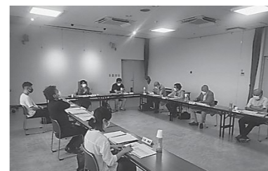
国土利用計画審議会開催の様子

瀬戸内市では、現在、農業地域、森林地域、自然公園地域があり、各地域の関係法令に基づいて、整備や保全を実施していますが、岡山県内の市の中で唯一、都市地域の設