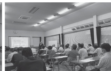
タウンミーティング開催の様子