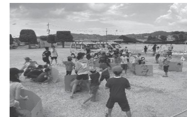
ダンボールを盾に水風船合戦（今城っ子クラブ）