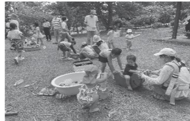
さまざまな遊び道具を楽しむ様子（貴船山ふれあい広場）