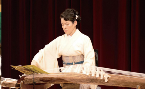
【表紙写真】第2回瀬戸内市民芸術祭