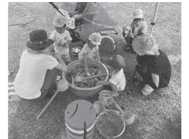
手作りの金魚すくい（長船町公民館の芝生）