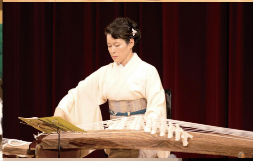
【表紙写真】第2回瀬戸内市民芸術祭