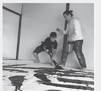
ワークショップの一例