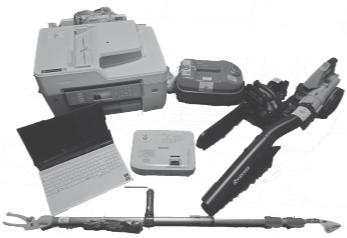
コミュニティ活動で使用するパソコンやプリンターなどを整備しました。