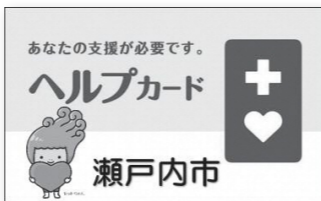
ヘルプカード（瀬戸内市版）