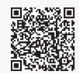
市ホームページ(ひとり親世帯分)