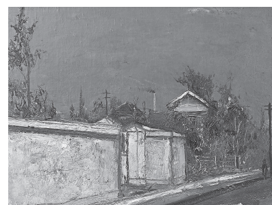
佐伯祐三「白い壁の家(下落合風景)」

本展では、小野竹喬、東山魁夷、平山郁夫などの日本画、梅原龍三郎、小磯良平、佐伯祐三などの洋画など新収蔵42点とともに、故・羽原氏