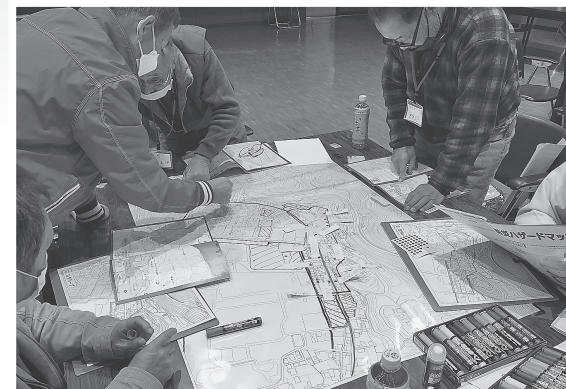
地域の危険箇所などを確認する参加者

参加者は、座学・演習を通して、防災リーダーとしての心構えや基本的な防災知識、災害対応時の思考力・判断力などを学びました。