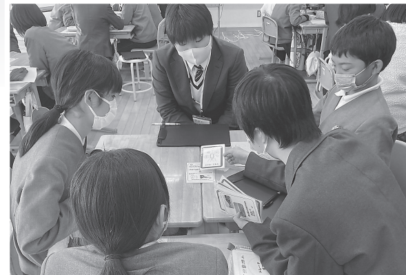
オリジナルのSDGsカードゲームを小学生に説明する邑久高校の生徒

児童らは、一緒に楽しくカードゲームを行う中で、地域課題を理解し、SDGsの達成に向けたアイデアを出し合っていました。