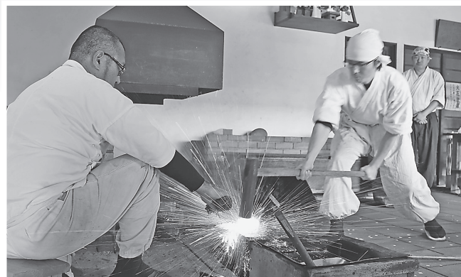
重い鎚を振り降ろし、玉鋼を打つ鍛錬の様子

1月8日、備前おさふね刀剣の里（長船町長船）で、1年の精進と無事故を祈願する打初式を行い、刀匠が火床に新年最初の火をおこしました。