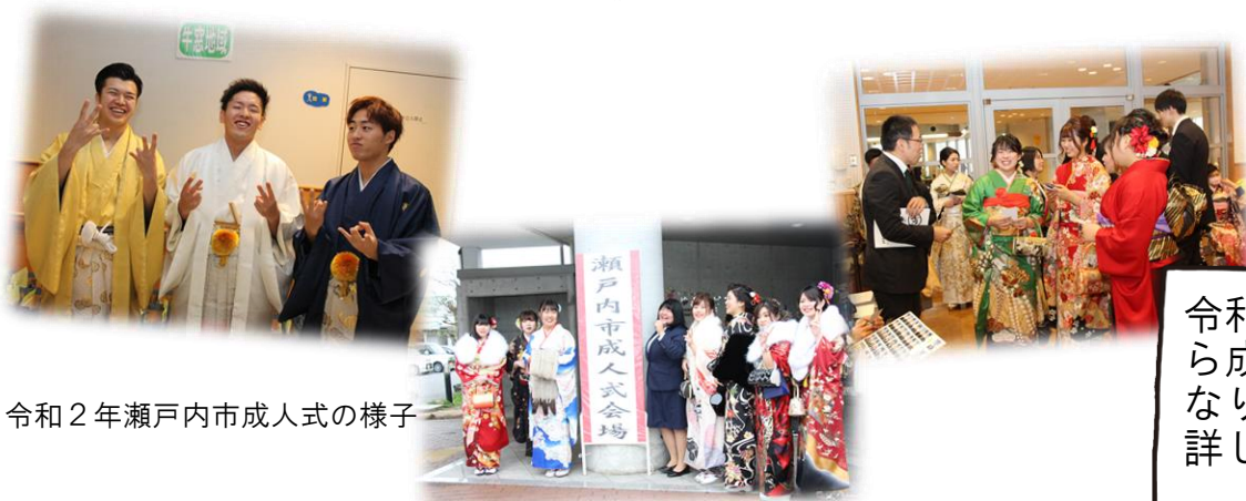
令和2年瀬戸内市成人式の様子