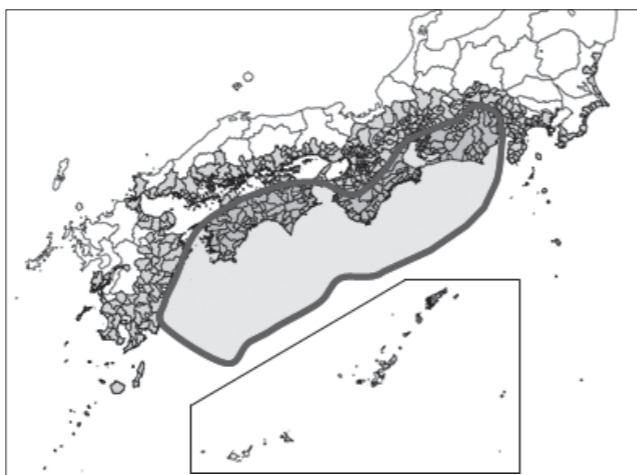
南海トラフ地震防災対策推進地域

「南海トラフ地震」とは、駿河湾から日向灘沖にかけてのプレート境界を震源域とした大規模地震です。おおむね 100～150 年の間隔で大規模地震が繰り返されていますが、過去の大地震からすでに 70 年が経過しており、次の南海トラフ地震がいつ発生してもおかしくない状況です。