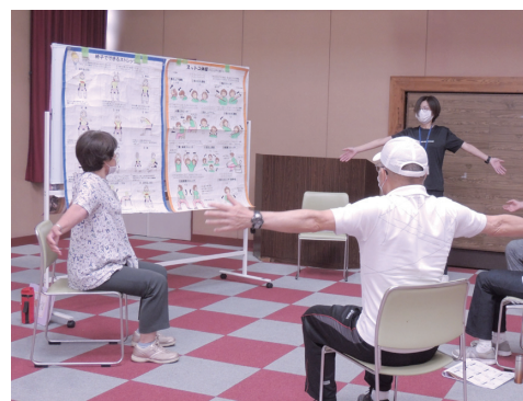
介護予防リーダー養成研修の様子

もが「いつまでも元気に、住み慣れた地域でいきいきと暮らしていく」ことを目指し、介護予防をすすめる地域づくりに取り組んでいます。この取り組みの一環である、地域の介護予防教室(はつらつ教室)や自主グループ活動などを支えているのが介護予防リーダーの皆さんです。 ・退職後の時間で何か始めたい ・介護予防って何をしているのか気になる ・特技や技術を瀬戸内市で生かしたい ・地域のことをもっと知りたい といった興味や関心のある人は、ぜひ地域を支える介護予防リーダーになってみませんか?