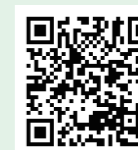
日本年金機構ホームページ

令和5年度分（令和5年7月から令和6年6月まで）は令和5年7月1日以降に申請できます。その他にも、失業や新型コロナウイルス感染症の影響により収入が減少し納付が困難な人向けの特例制度もあります。詳しくは日本年金機構のホームページをご覧ください。