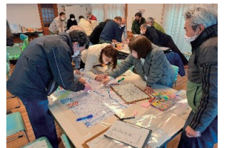
磯上自主防災会／防災マップ作成の様子

危機管理課では、災害に関する基本的な知識や備えの方法、自主防災組織の活動の進め方などについて防災出前講座を行っています。防災出前講座の開催を希望する場合は、危機管理課へご連絡ください。