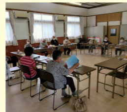
下笠加ふれあいサロン 防災学習会の様子

危機管理課では、自主防災組織のほか、地域のサロン会や老人クラブ、保育園、幼稚園、小中学校、福祉事業所などと連携し、防災知識の普及啓発を進めています。「防災」をテーマに、地域で取り組んでみたいとお考えの人は、お気軽にご相談ください。