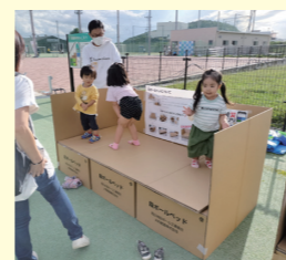
こどもひろば 段ボールベッド展示の様子