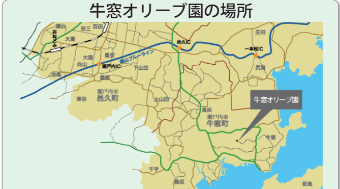
牛窓オリーブ園の場所

障害のある人へのサービス(事前申請が必要)を紹介します。対象者、条件などにより、サービスを受けられない場合がありますので、詳しくはお問い合わせください。 ①運賃の割引など 電車やバス、タクシーなどを利用する場合に手帳を提示すれば、運賃の割引が受けられます。 ▼対象者 身体障害者手帳・療育手帳・精神障害者保健福祉手帳所持者 【福祉タクシー利用券】 在宅の重度障害者に対して、タクシー料金の一部を助成する福祉タクシー利用券を交付しています。 ▼対象者 在宅の身体障害者手帳1・2級所持者および療育手帳A所持者 ②医療費の助成 【育成医療・更生医療】 障害の軽減などのため、治療・手術を受ける場合、医療費の一部が医療保険と公費で助成されます。 ▼対象者 18歳未満の身体に障害や疾病を有する児童、18歳以上の身体障害者手帳所持者 【精神通院医療】 病院などに通院する場合、医療