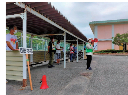
百田町内会自主防災会／避難訓練の様子

自主防災組織は、自治会や連合町内会、コミュニティ・まちづくり協議会、学区など、地域の特性や取り組みの進めやすさに応じてさまざまな単位で結成することができます。地域で自主防災組織を立ち上げ、規約と組織図を作成し、危機管理課に届け出ましょう。