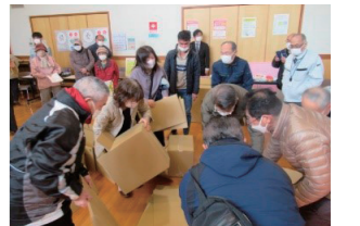
鹿忍まちづくり協議会／防災訓練の様子