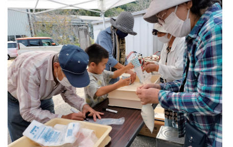
本庄地区自主防災会／炊き出し訓練の様子

これまでの大規模災害の教訓から、行政主導の災害対策では限界があり、住民主体の防災対策を進めていく必要があるといわれており、自主防災組織は、そうした対策の核となる組織です。