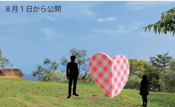
アートスポット設置イメージ ※山頂広場「恋人の鐘」近くに設置予定