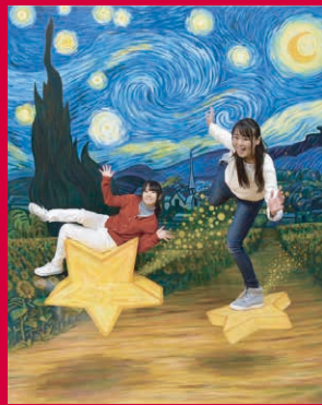
星月夜のスターライド