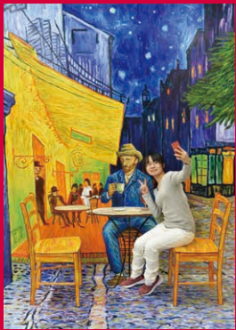
ゴッホとカフェで