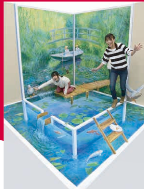
モネの睡蓮のプール

モネの代表作『睡蓮』をモチーフに、トリックアートだから出来る不思議な空間が実現。