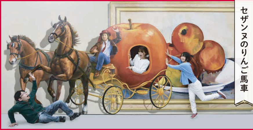
セザンヌのりんご馬車

描かれている絵のはずの『りんご』が、馬車になって飛び出してきた?! なんだかインディ・オヨーンズみたいな人がいるけど…、とにかく大変だあ〜!!