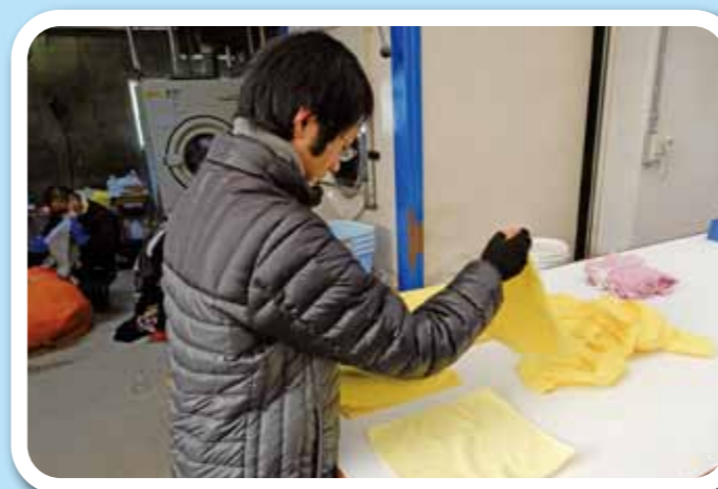
事業所での仕事風景