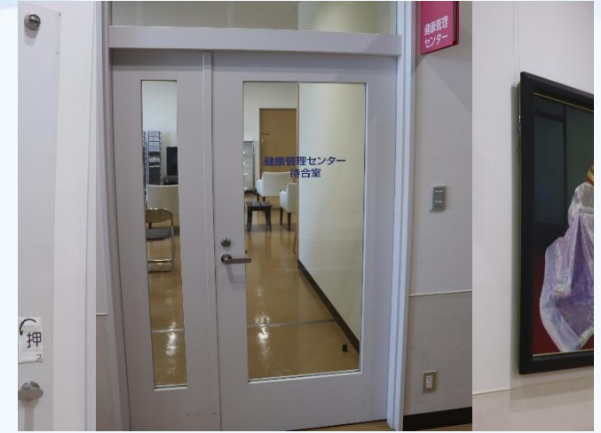
健診当日は、健康管理センターの受付へお越し下さい