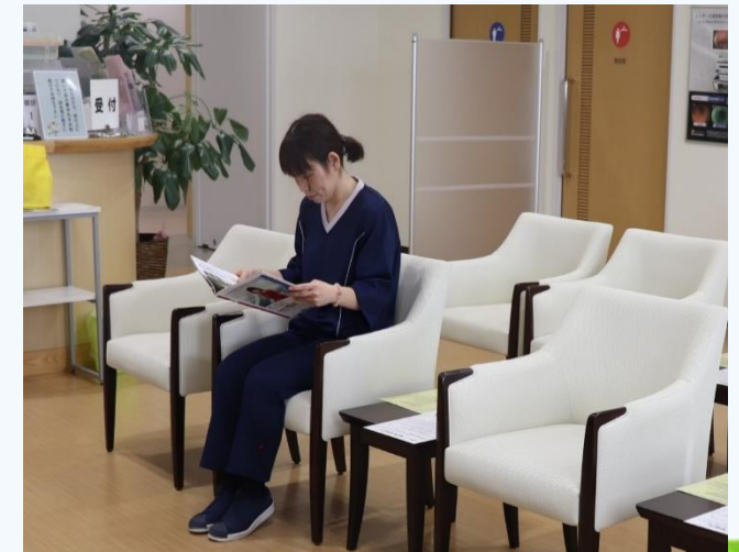
着替えが終わったら、待合でお待ちください