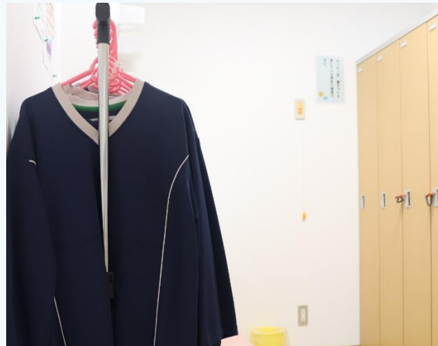
更衣室で着替えをします