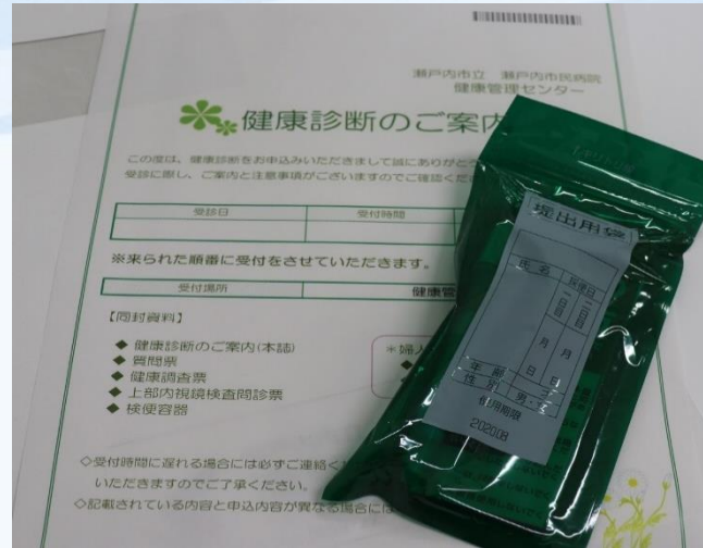
事前に案内文を送付します