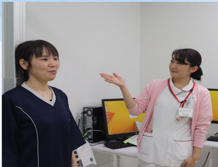
身長・体重・腹囲測定