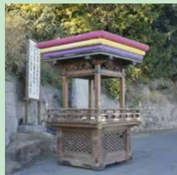
本町太鼓台 (どんでんどん)