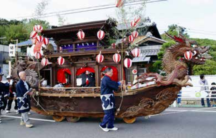
牛窓だんじり (関町だんじり)

だんじり以外は素木造です。御召船風に造った東町の御船から明治のはじめにかけて造られたもので、漆塗りのだんじり以外には素木造です。