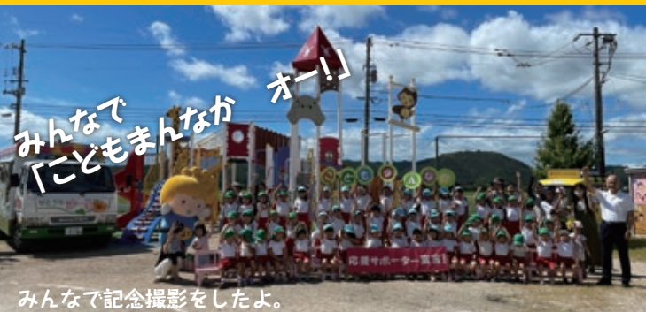
みんなで記念撮影をしたよ。

畠久保育園のみんなといっしょに宣言したよ。記念プログラム「子どもまんなかパーク」ではみんな元気いっぱい遊んだよ♪