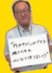
難波 利光 副市長 なんば としみつ