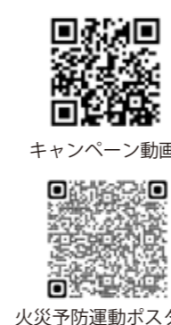
キャンペーン動画