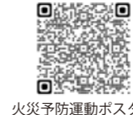
火災予防運動ポスター