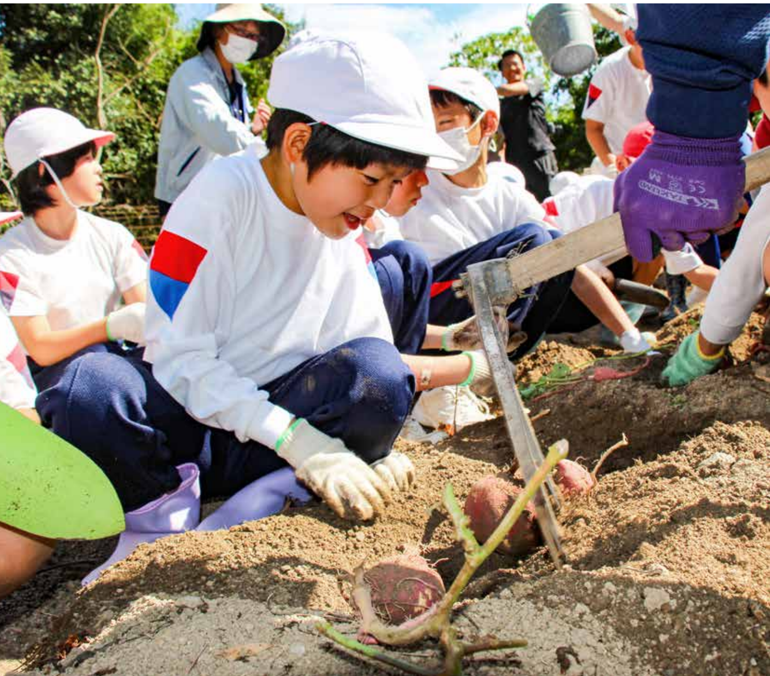
【表紙写真】さつまいも掘り(邑久町虫明・裳掛小学校)