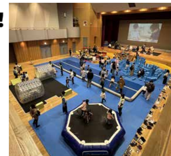
昨年度開催の様子

市では、外遊びを楽しむ「こどもひろば」の取り組みとして、幅広い年齢の子どもたちが楽しめる全天候型の遊び場「こどもパーク」の計画を進めています。