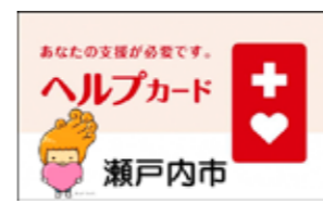
瀬戸内市ヘルプカード