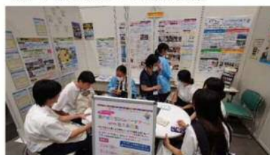
おこやまSDGsフェアに共同出展