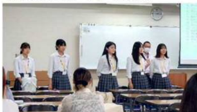
大学でのSDGカードゲームの紹介