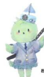
邑久高校マスコットキャラクター せおちゃん