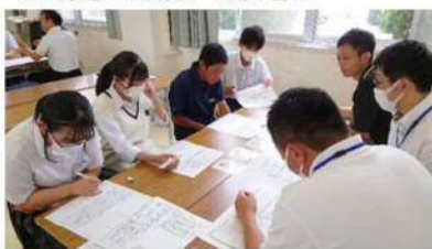
市の課題を市職員から聞き書き