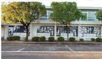
体育館に作成されたズグラフフィート壁画