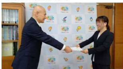
地域おこし協力隊の任命