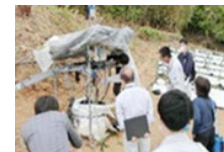
新たな担い手への指導