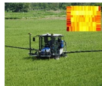
生育センサー付き 可変施肥機