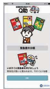
緊急度の分類説明