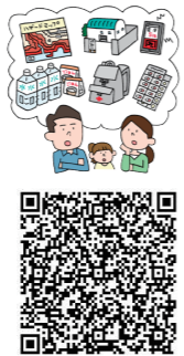
申し込みフォーム （岡山県電子申請サービス）