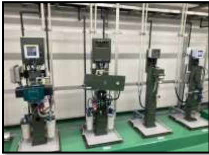
（福山浄水場水質計器）