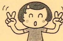
両手のチョコキを顔の両脇で動かします。