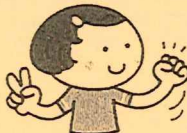
左手をゲーにします。