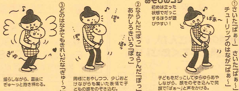
揺らしながら、最後に ぎゅ〜と抱き締める。