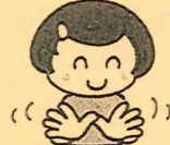
両手の親指を重ねて、手をひらひらと動かします。