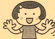
右手をパーにし、次に左手もパーにします。