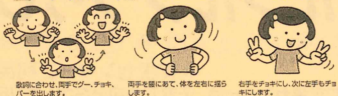
歌詞に合わせて、両手でゲー、チョコキ、パーを出します。

1-3歳 ① ♪ ゲーチョコキパーでゲーチョコキパーで ② ♪ なにつくろうなにつくろう ③ ♪ みぎてがチョコキでひだりてもチョコキで