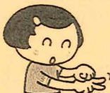
チョコキの上にゲーのをせます。