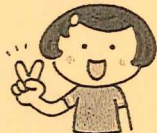
右手をチョコキにします。