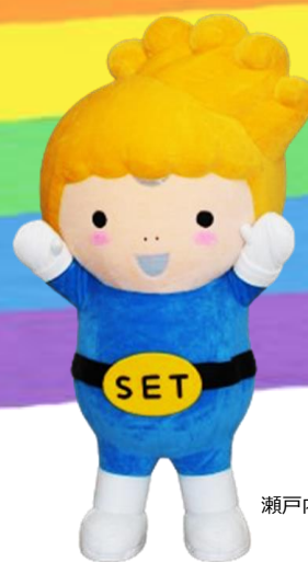
瀬戸内市マスコットキャラクター セットちゃん