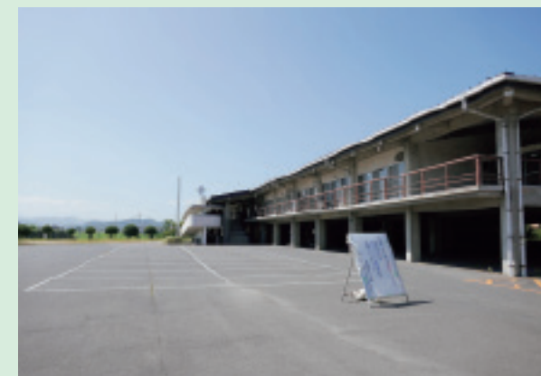
長船町公民館跡地

令和 6 年 7 月 2 日には、ゆめトピア長船が長船町公民館、長船図書館、文化センターの複合施設としてリニューアル開館しました。ゆめトピア長船周辺土地には、全天候型の遊び場「こどもパーク」の整備を行います。