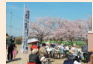
▲つくしカフェの様子（4月）