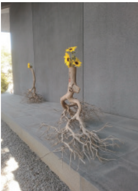
役重佳廣「生生世世」

▽観覧料 一般500円、団体（20人以上）・65歳以上400円、中学生以下無料 ▽開館時間 午前9時30分～午後5時（入館は午後4時30分まで） ▽休館日 毎週月曜日（月曜日が祝日・振替休日の場合は開館、翌日休館） ▽場所 瀬戸内市立美術館 岡瀬戸内市立美術館 ☎0869・34・3130