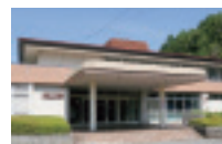
長船スポーツ公園体育館

長船スポーツ公園体育館について、老朽化により雨漏りや天井ボードの剥落が発生している部分があるため、屋上防水改修工事を行います。