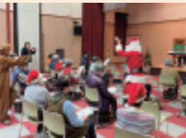
▲つくしカフェの様子（12月）