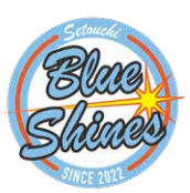
瀬戸内ブルーシャインズ