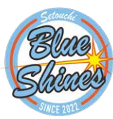
瀬戸内ブルーシャインズ