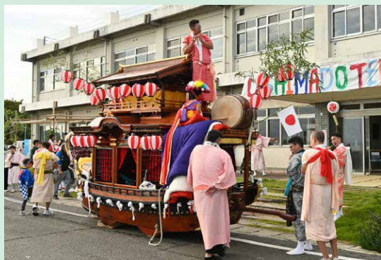
町内を練り歩く獅子だんじり