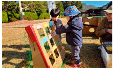
令和7年12月開催の様子