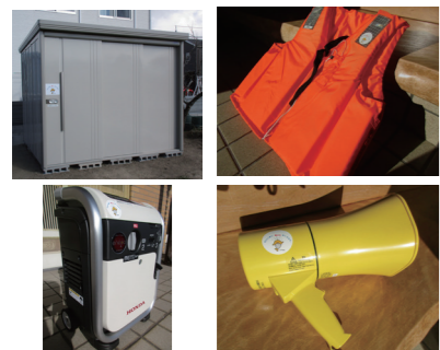
整備した防災資機材