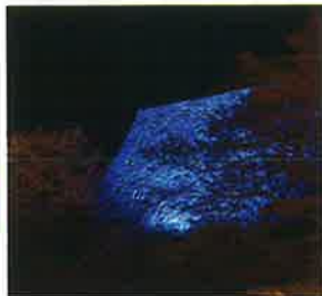
鶴山公園北側城壁(津山市)