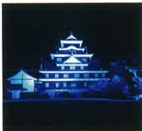
岡山城天守閣(岡山市)