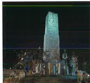
JR笠岡駅時計台(笠岡市)