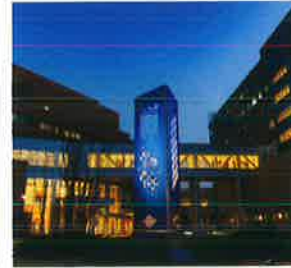
倉敷成人病センター(倉敷市)