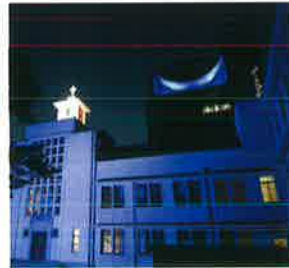
ノートルダム清心女子大学(岡山市)