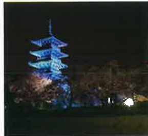
備中国分寺五重塔(総社市)