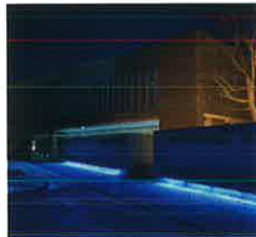
ペスタロッツ館(鏡野町)