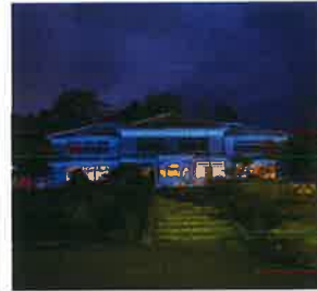
旧吹屋小学校(高梁市)