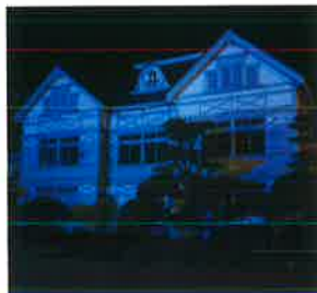
旧遷喬尋常小学校(真庭市)