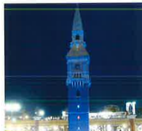
JR倉敷駅北口時計台(倉敷市)