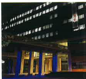
岡山県庁舎ピロティ(岡山市)