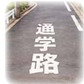
安心して通学できるよう目立つ路面標示