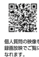
個人質問の映像を録画放映でご覧いただけます。