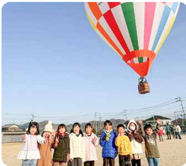
春から1年生 みんなで気球に乗ったよ (行幸幼稚園)