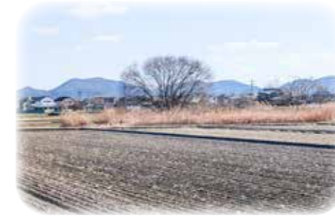
水田の中の耕作放棄地

問 市の食料自給率向上と地産地消を推進しているか。 答 振興公社と連携して都市圏の就農フェア参加や県、JA等関係機関とも連携し就農相談等実施している。国の交付金を活用し、年間5人の新規就農者の確保目標を持っている。