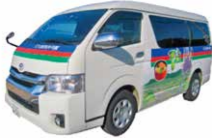
改善が求められるワゴン車の市営バス

ワゴン車の路線を土日運行や時間延長することは、利便性向上に効果は期待される。しかし経費や運転手の問題がある。市民や利用者の声を丁寧聞きながら地域公共交通会議の合意を前提にサービス改善に努める。