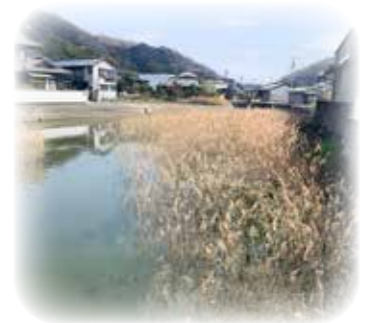
兆しが見えてきた鹿忍港

相手方の感触としては、現在ある構造物、護岸の構造がどのようなものか等、それらの安定性を検討していくと聞いている。県も非常に前向きに実施したい方向で進んでいる。