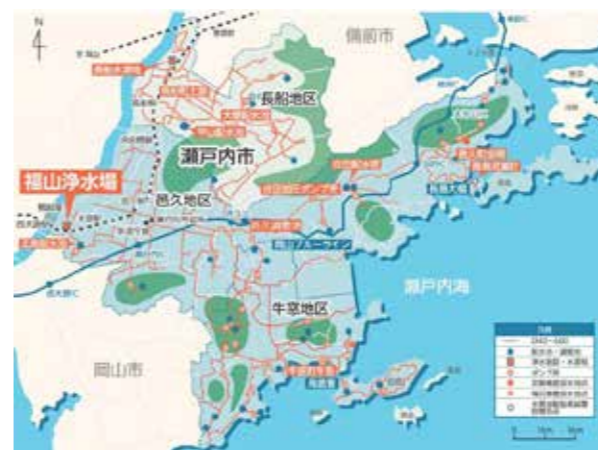
本市の上水道施設配置図

人口減少を前提にコスト削減を続けつつ、瀬戸内市の可能性を踏まえ未来への投資を重視する方針。これまでの健全な財政基盤と信頼を生かし、子育て支援など将来を見据えた施策に取り組み。