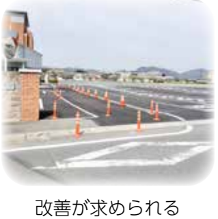
改善が求められる ゆめトピア長船駐車場入り口