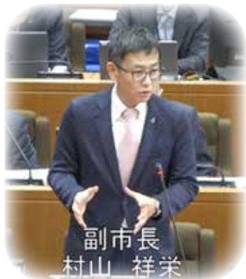
副市長 村山 祥栄

副市長には、行政全体の運営基盤を支える役割を果たしつつ、多様な施策が実効的に推進されるよう、庁内各部署間の連携強化や、課題解決に向けた調整を期待している。