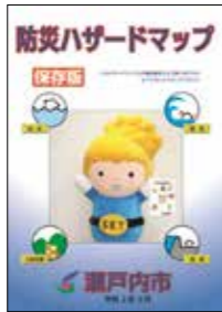
現在のハザードマップが改訂されます

各種災害想定に加え、家庭の防災行動、自主防災組織の活動、避難生活の関する情報、男女共同参画の視点など盛り込む予定。