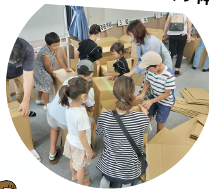
段ボールベッドづくり体験