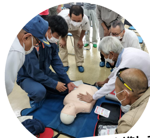
消防署と連携して AED講習会