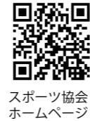
スポーツ協会 ホームページ