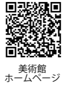
美術館 ホームページ

牛窓をテーマに 「田面硯で墨を磨る・かく」 日時(予約不要) 6月20日(土)、21日(日) 午前10時～午後4時