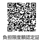
負担限度額認定証

事業対象者、要支援、要介護の認定を受けた人全員に、自身の負担割合(1/3割)を記載した「介護保険負担割合証」を7月上旬ごろに発送予定です。なお、更新手続きは不要です。