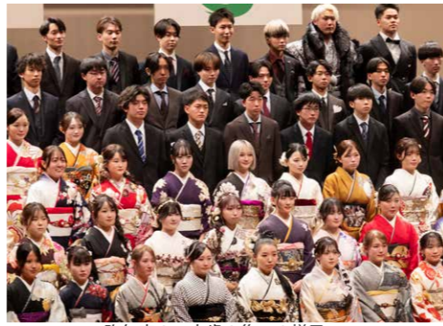
昨年度の二十歳の集いの様子