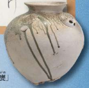
寒風出土須恵器「大甕」