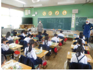
4/12 (火) はじめての給食 (1年)