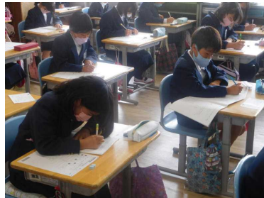
4.19(火) 学力・学習状況調査