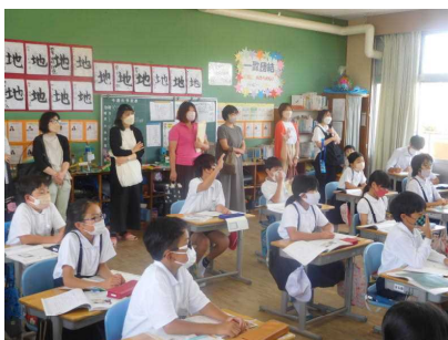
6月参観日(全学年; 6月8日)