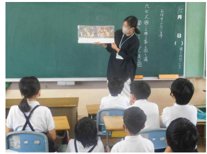
ここたね(全学年; 6月7日)