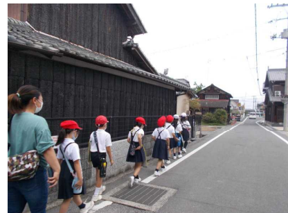
安全マップづくり(3年; 6月16日)