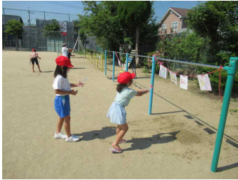
1年生 生活科「水遊び」