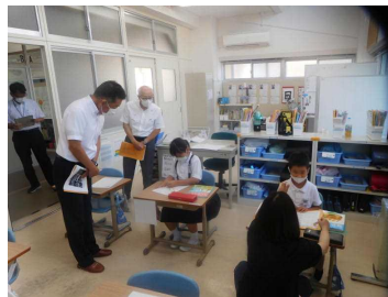
7月7日（木） 学校評議員会