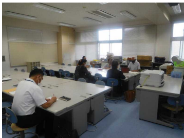
7月4日（月） 地域教育協議会

今年度の今城小学校の様子を、地域教育協議会や学校評議員会、民生委員児童委員や主任児童委員の方々に見ていただいたり、お伝えしたりしました。いただいたご助言等を取り入れながら、今後の学校運営にいかしていきたいと思っております。ありがとうございました。