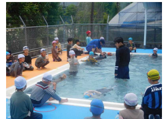
7月11日（月） 着衣水泳（2年）

また、水の事故から自分や友達の命を守るために、着衣水泳を実施しました。服を着たまま水に入ると体の自由がきかず動きにくいことを体験し、どのようにすれば大切な命を守ることができるのかを学年のめあてに沿って学習しました。