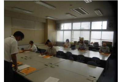
7月14日（木） 民生委員児童委員