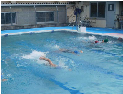
7月7日（木） 水泳発表会（3年）