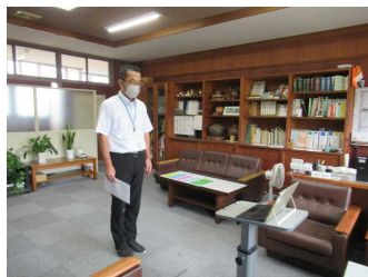
9月1日(木) 始業式 ZOOM にて