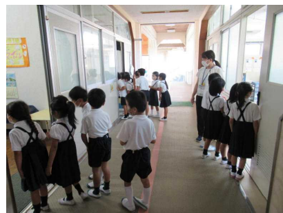
挨拶運動に加わる1年生

さて、始業式の中で「あいさつ+1作戦」について子どもたちに話をしました。手前味噌ですが「今城っ子たち」は、あいさつをよくする子どもたちだと思います。さらなるレベルアップとともに、本当のねらいは、あいさつを通しての『自己有用感』の向上です。声が出せない場所で会話をしたり、あいさつの前に「〇〇さん、おはよう」や「おはよう、今日元気？」などと言添えたりと、子どもたちなりに「+1」を意識した活動になってきました。さらに、運営委員会がはじめたあいさつ運動に、運営委員会以外の子どもたちも加わり、あいさつの輪が広がりつつあります。子どもたちの実態にあったやり方だと思います。ぜひとも、ご家庭でも地域でも、あいさつの輪を広げていき、この活動を通してさらに笑顔あふれる今城にしていきたいと思います。