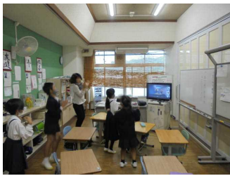
10/17(月) リズムジャンプ(全校)