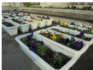
花いっぱい運動 (パンジー)