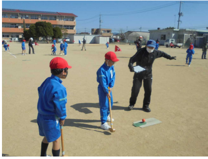
3/6 (月) グランドゴルフ (2年生)