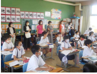
6月参観日（全学年；6月7日）