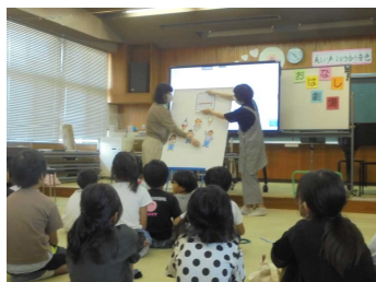
7/27 おはなし劇場 (音楽室)