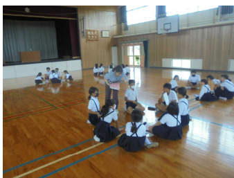
9月1日(金) 地区児童会