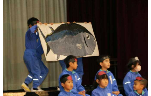
～ 2年生 ～