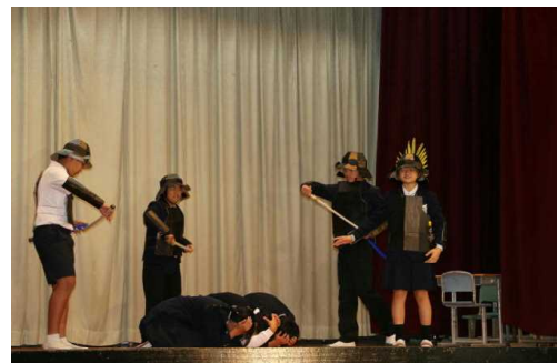
～ 6年生 ～