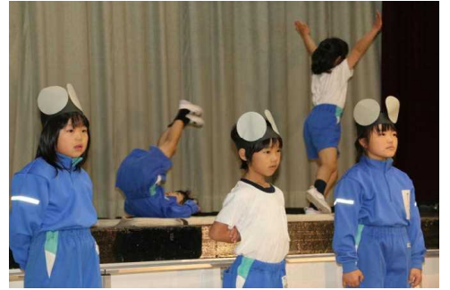
～ 1年生 ～