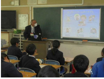
非行防止教室 6年 11/16 (木)