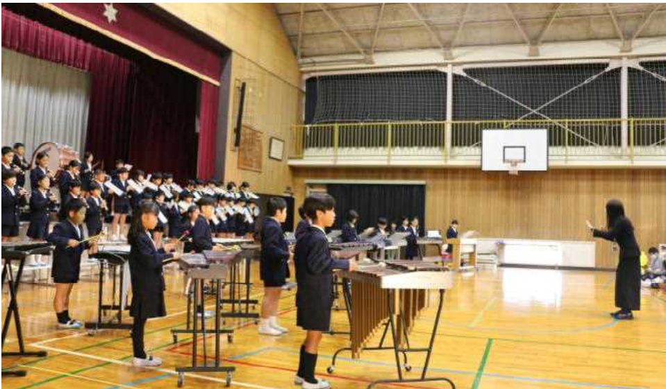
～ 3・4年生 ～