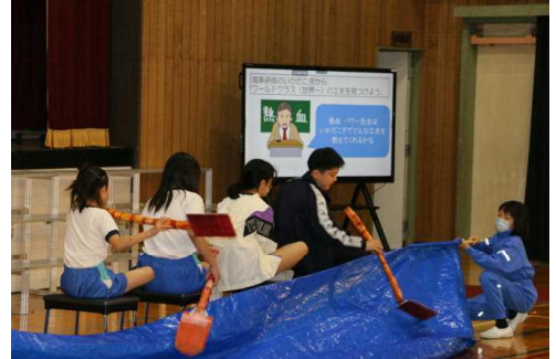
～ 5年生 ～