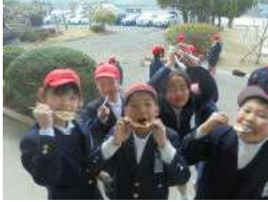
3/13 (水) 七輪体験 (3年)