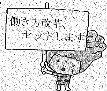
瀬戸内市マスコット「セットちゃん」